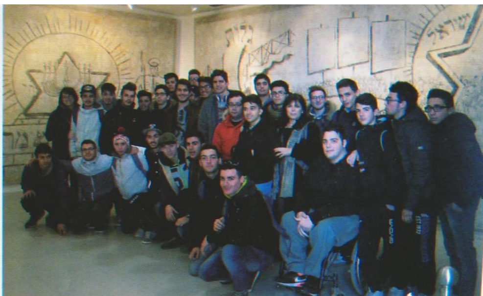
Gli alunni dell'Ipsiam San Francesco da Paola al Museo della Memoria di Nardò