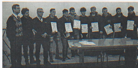
Gli attestati consegnati agli studenti dell'Ipsiam

S abato scorso presso l'aula Magna dell'Ipsiam "San Francesco da Paola" - I.I.S.S. "Luigi Russo", si è svolta la manifestazione di consegna degli attestati della III Area professionalizzante conseguiti da ben 24 alunni dell'Ipsiam. I percorsi biennali di qualifica previsti per le classi IV e V dell'Istituto Professionale, finanziati dal POR Puglia F.S.E. 2007/2013, hanno permesso di realizzare itinerari didattici di cooperazione tra formazione professionale, sistema dell'istruzione secondaria superiore e mondo del lavoro. Gli studenti, alla fine del quinto anno, hanno conseguito, oltre al diploma di Stato, la cosiddetta "maturità integrata": quattro differenti specializzazioni in Installatore di impianti elettrici nelle costruzioni civili; Tecnico installatore di impianti elettronici; l'tecnico progettista disegnatore meccanico e Acquaicolto ed assimilati. Il percorso, che ha avuto una durata complessiva di 600 ore, è stato caratterizzato da una formazione in aula condotta da esperti con specifiche esperienze nel mondo del lavoro e della produzione e attività di stage aziendale. Durante l'esperienza in azienda (sono state coinvolte importanti realtà produttive del territorio: di Monopoli sono la Mermec, la Sem Antifurti elettronici, la Sat Media Wordl, la Cisam (Carpenteria industriale,